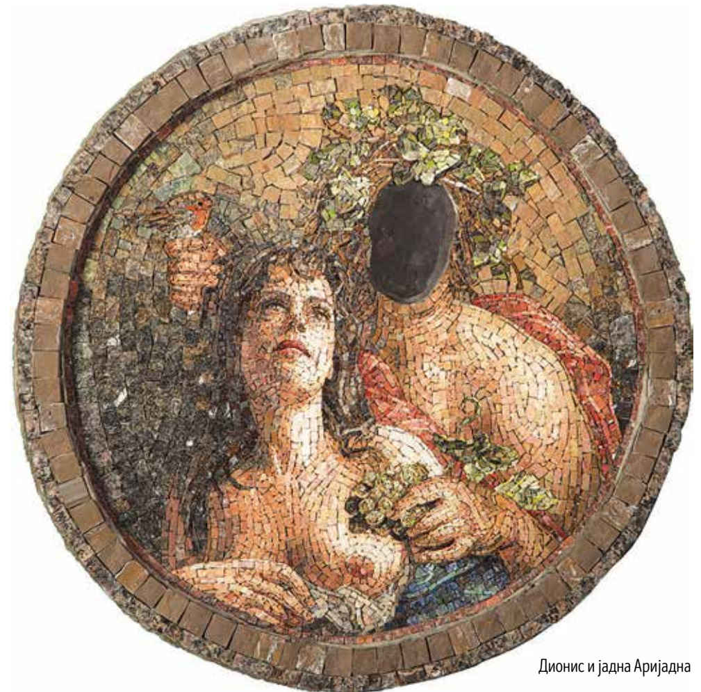
Дионис и јадна Аријадна

Београд, Маријане Грегоран 69 ✉ bisenija.terescenko@gmail.com ☎ +38163 175 1627 🌐 mozaik-art.com 📘 Bisenija Terescenko Skola crtanja slikanja i mozaika 📷 mosaicpaintgts