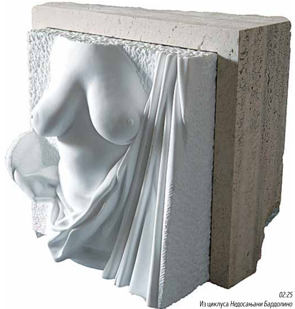
02:25 Из циклуса Недосањани Бардолино